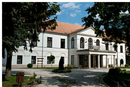
halt miniszterelnök emlékére.

Nádasdy kastély , mely országos műemléki védelem alatt áll. Az épületről az első írásos emlékek 1800-ból valók, később ezt az épületrészt bővítette, korszerűsítette ifjú Nádasdy Tamás s a kastély 1820-ban nyerte el ma is látható formáját. A Nádasdyak után a Festeticsek birtokához tartozott, majd 1858-ban vásárolta meg a svájci emigrációból hazatért özv. Batthyány Lajosné. A grófné emlékszobát alakított ki a mártírhalált